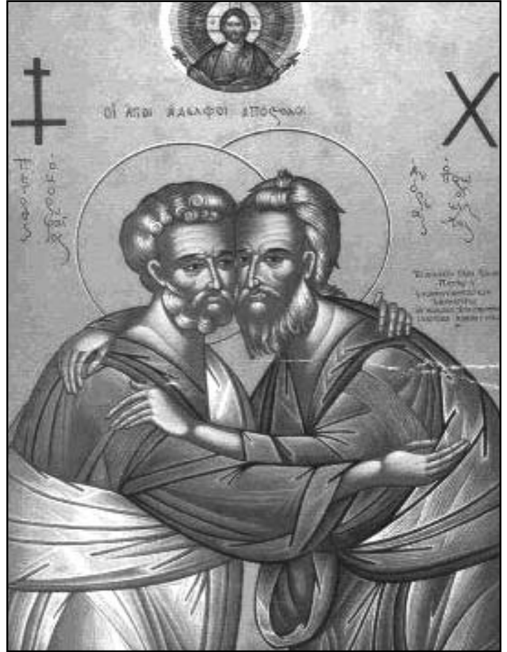
Les frères apôtres se donnent le baiser de paix. Pierre est le patron de Rome, André celui de Constantinople.

par Laurent Blanchet avec la collaboration du Père Thierry Schelling