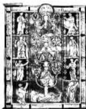
La vie de Raban Maur à Mayence (Allemagne). Enluminure de Anchin (XIII e siècle).

Jésus, rédempteur de tous les hommes, Avant que naisse la lumière, Le Père souverain t'avait engendré Dans une splendeur semblable à la sienne.